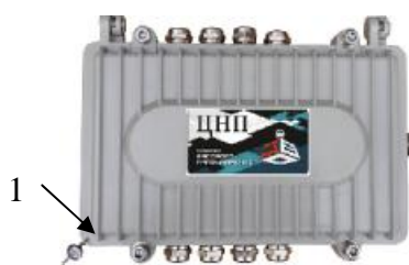
Рисунок 6 – Схема пломбировки нормирующего преобразователя ЦНП (1 – свинцовая или пластиковая пломба)