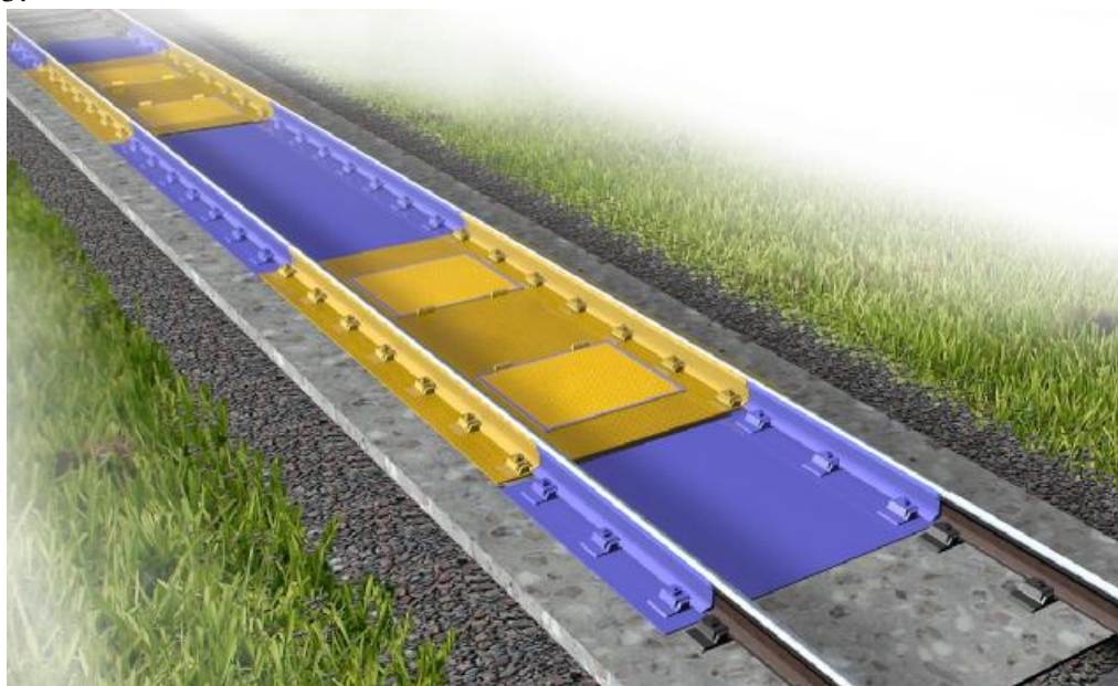
Рисунок 1 – Пример общего вида ГПУ весов

Пример общего вида ГПУ весов и весоизмерительных приборов представлены на рисунках 1 – 3.