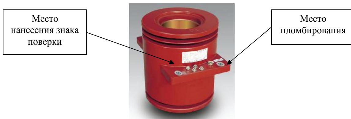
Рисунок 1 - Внешний вид трансформаторов