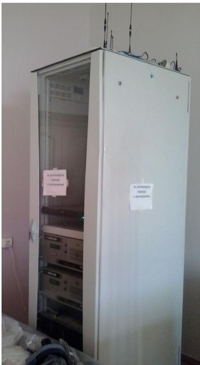
Рисунок 2 – Место пломбирования сервера АСКУ ТЭР