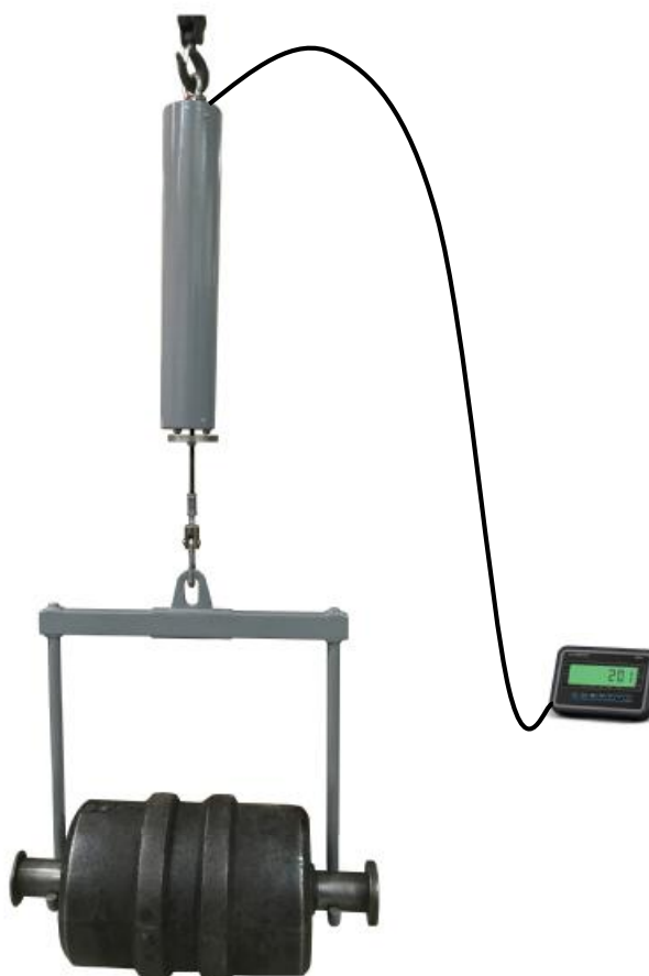
Компаратор с индикатором тип 3