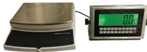
Компаратор с индикатором тип 1 в нержавеющей корпусе