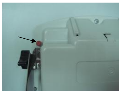
Рисунок 4 – Схема пломбирования компараторов от несанкционированного доступа

Пример схем пломбирования компараторов от несанкционированного доступа представлен на рисунке 4.