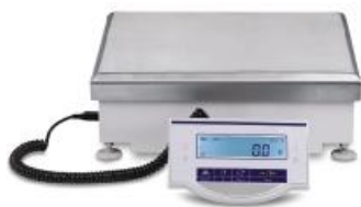
Компаратор с индикатором тип 2

Компараторы могут быть оборудованы гидравлическим, пневматическим или механическим устройством для безударного плавного опускания и подъема гирь.