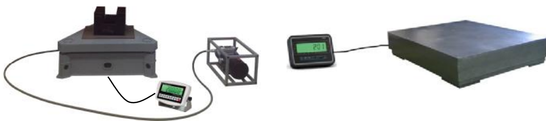
Компаратор с индикатором тип 1 в пластиковом корпусе