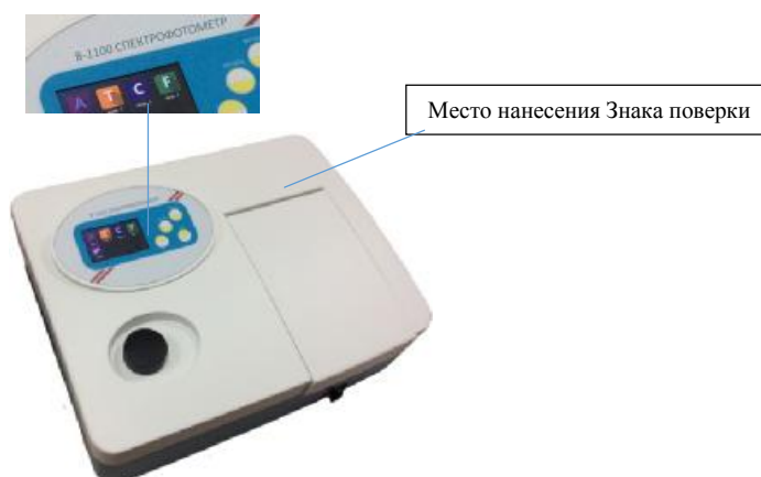
Рисунок 1 - Внешний вид спектрофотометров моделей В-1100, УФ-1100

Тип спектрофотометров включает в себя модели с ручным сканированием спектра: УФ-1100, В-1100, УФ-1200, В-1200 и модели с автоматическим сканированием спектра: УФ-1800, УФ-3000, УФ-3100, УФ-3200, УФ-6100. Модели с обозначением В и УФ отличаются спектральным диапазоном. Спектрофотометры управляются от встроенного микропроцессора, имеют мембранную клавиатуру, сенсорный или ЖК-дисплей и кюветное отделение, рассчитанное на установку кювет с длиной оптического пути до 100 мм. Внешний вид спектрофотометров приведен на рисунках 1, 2, 3, 4.