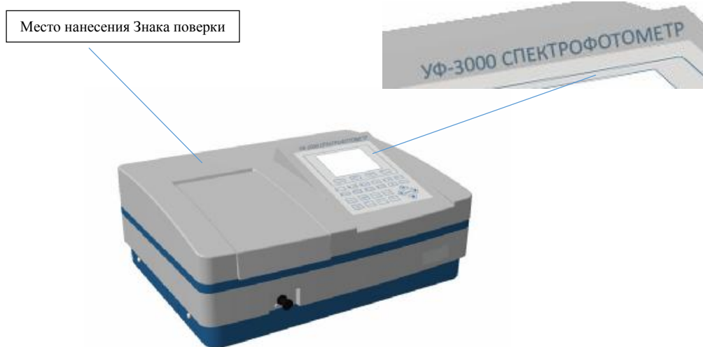
Рисунок 4 - Внешний вид спектрофотометров моделей УФ-3000, УФ-3100, УФ-3200, УФ-6100