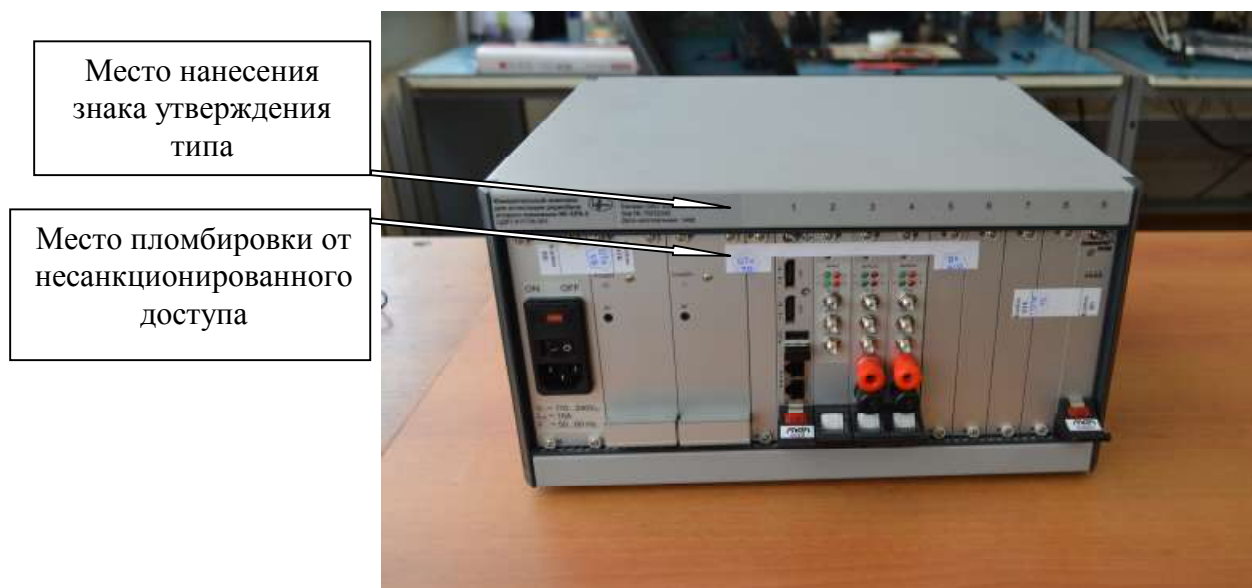
Рисунок 2 – Блок ИК