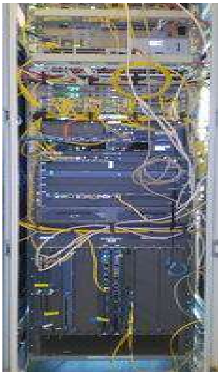
Рисунок 1 - Общий вид оборудования

Общий вид оборудования и схема блокировки от несанкционированного доступа, представлены на рисунках 1 и 2.