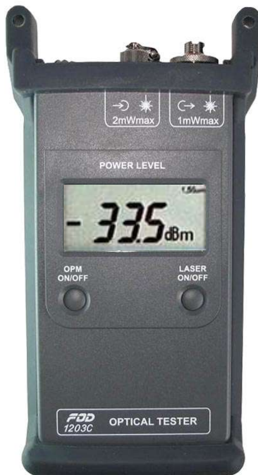
Рисунок 2 - Общий вид тестера оптического FOD-1203

Метрологические и технические характеристики приведены в таблице 1.