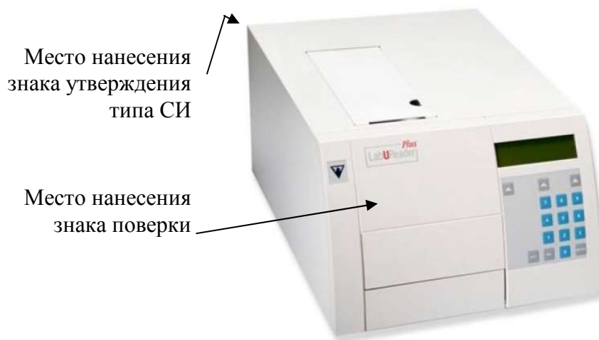
Рисунок 1 - анализаторы исполнения LabUReader Plus

Общий внешний вид анализаторов исполнения LabUReader Plus показан на рисунке 1, исполнения LabUReader Plus 2 - на рисунке 2.