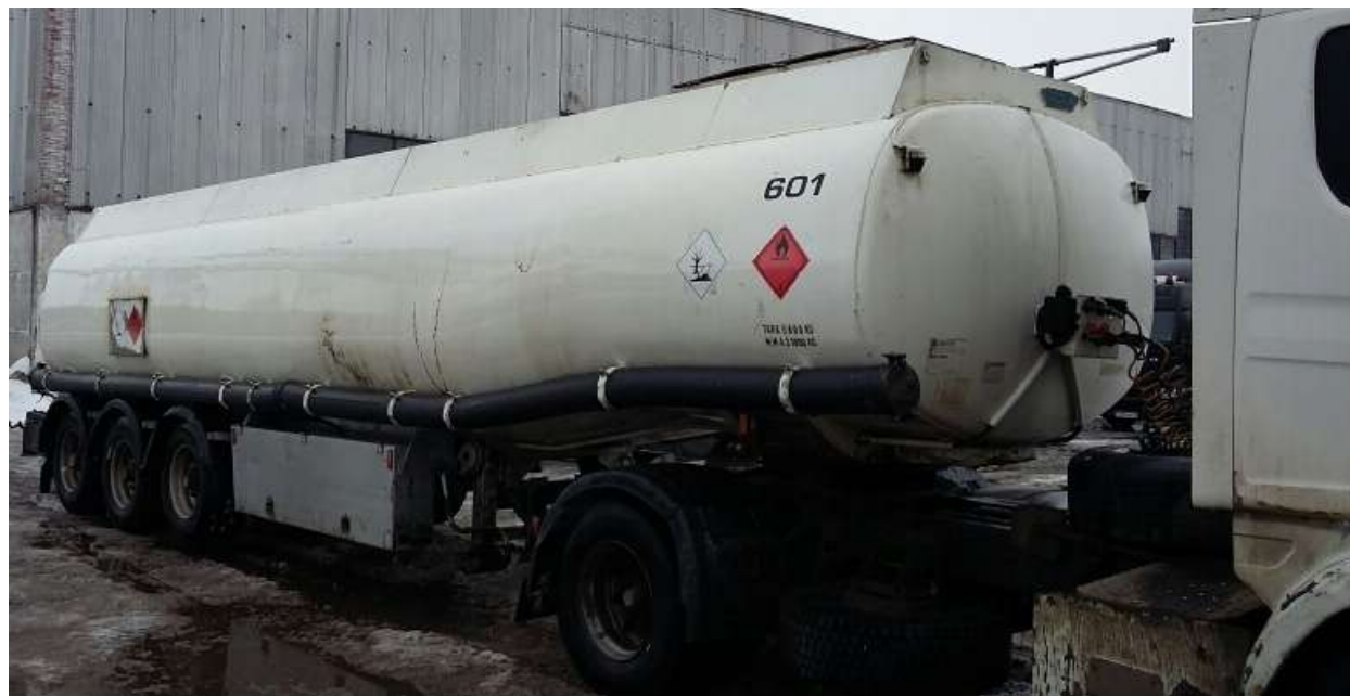
Фото 1 - Общий вид полуприцепа-цистерны INDOX

На боковых сторонах и сзади ППЦ нанесены знаки с информационными табличками для обозначения транспортного средства, перевозящего опасный груз.