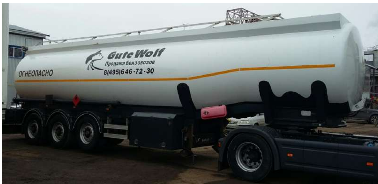
Фото 1 - Общий вид полуприцепа-цистерны GUTE WOLF DMD

На боковых сторонах и сзади ППЦ имеет надпись «ОГНЕОПАСНО», знак ограничения скорости и знаки с информационными табличками для обозначения транспортного средства, перевозящего опасный груз.