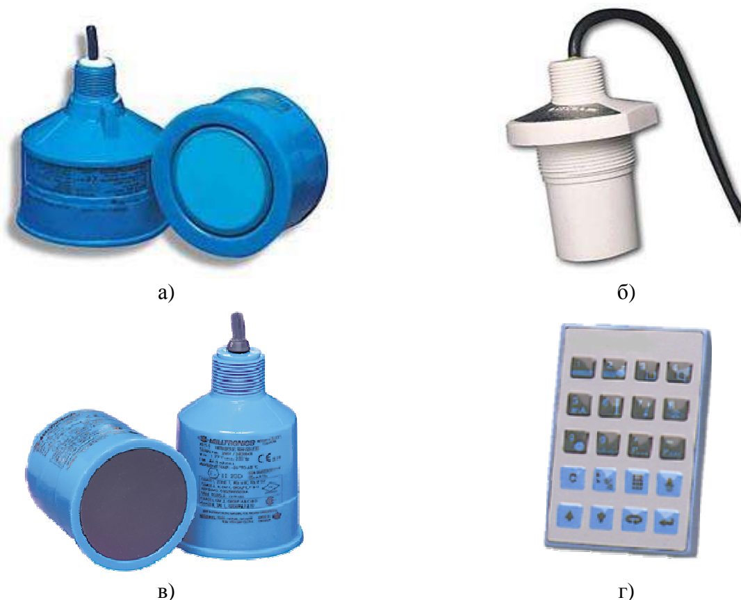
Рисунок 2 - Внешний вид ультразвуковых преобразователей ST-H, XPS, XRS: а) преобразователи XPS; б) преобразователи ST-H; в) преобразователи XRS; г) программатор 7MLxxxx-xxx