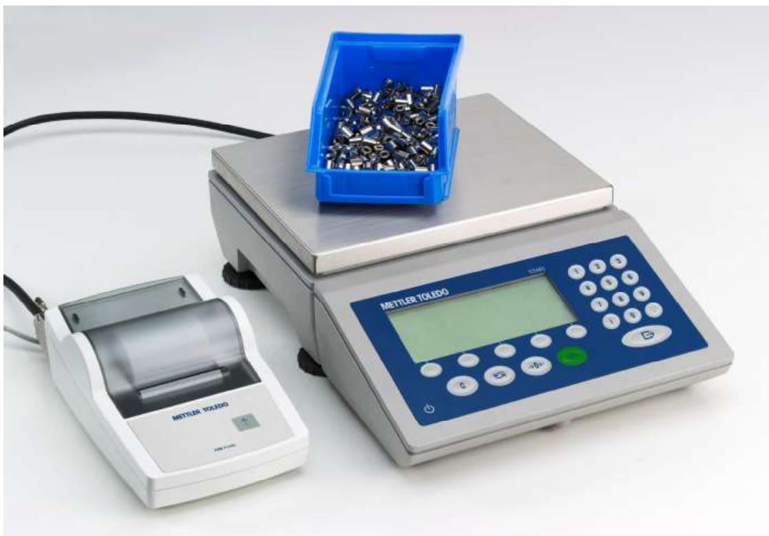
Рисунок 4 - Общий вид весов модификации ICS465s-35LA/f