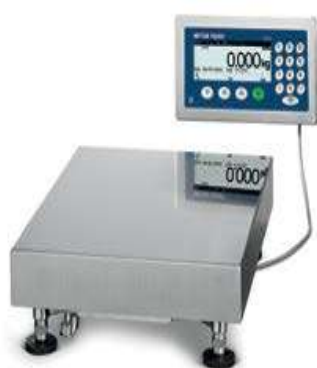
На столе или стене (t - версия)