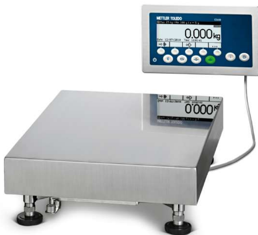
Рисунок 8 - Общий вид весов модификации ICS449g-A15/t