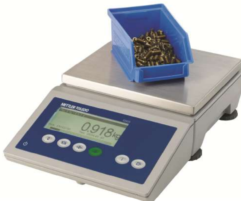
Рисунок 1 - Общий вид весов модификации ICS425s-6SM/f

Общий вид весов показан на рисунках 1-10. Возможные способы размещения терминала в составе весов показаны на рисунке 11.