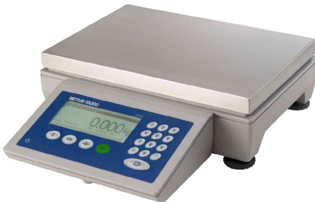
Рисунок 2 - Общий вид весов модификации ICS435s-15LA/f