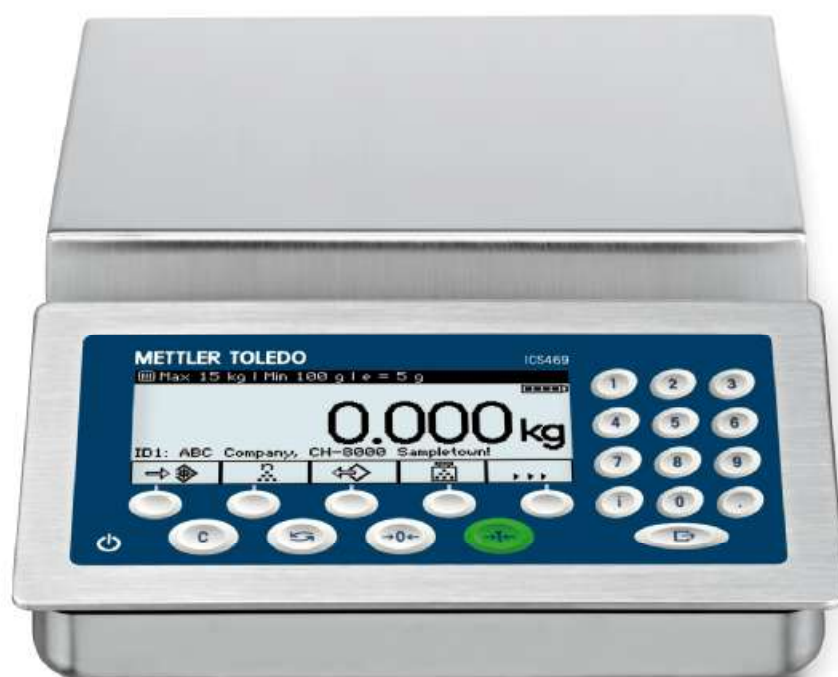
Рисунок 9 - Общий вид весов модификации ICS469g-A15/f