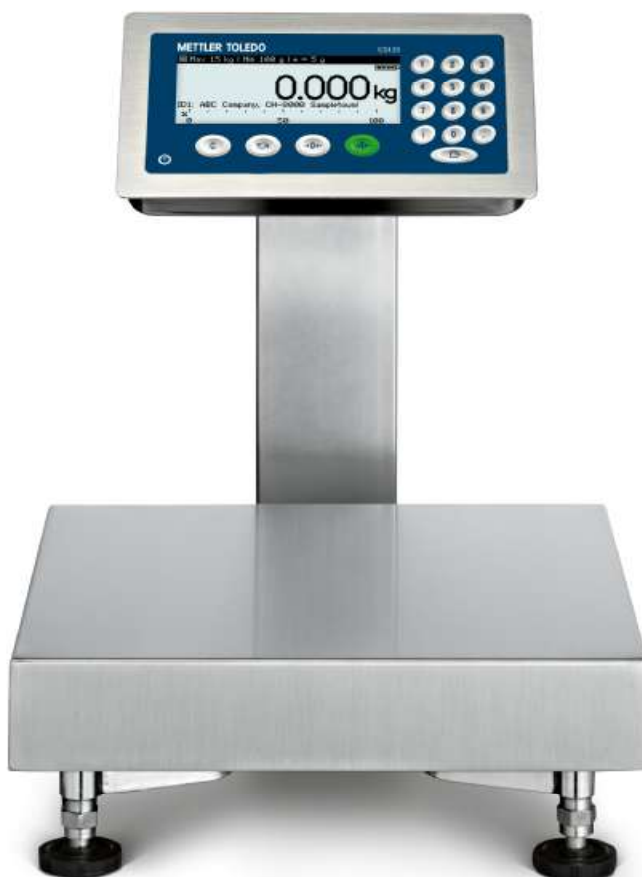
Рисунок 7 - Общий вид весов модификации ICS439g-A15/c