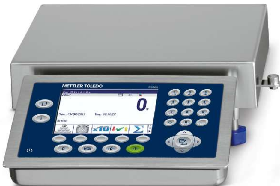
Рисунок 10 - Общий вид весов модификации ICS689g-A15/f