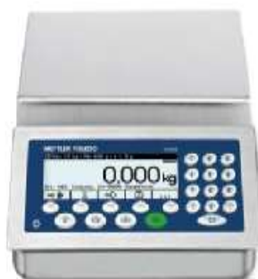
На кронштейне (f - версия )