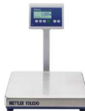
На стойке (с - версия )