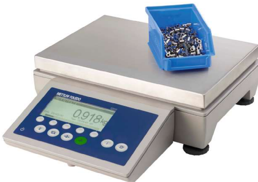
Рисунок 3 - Общий вид весов модификации ICS445s-6SM/f