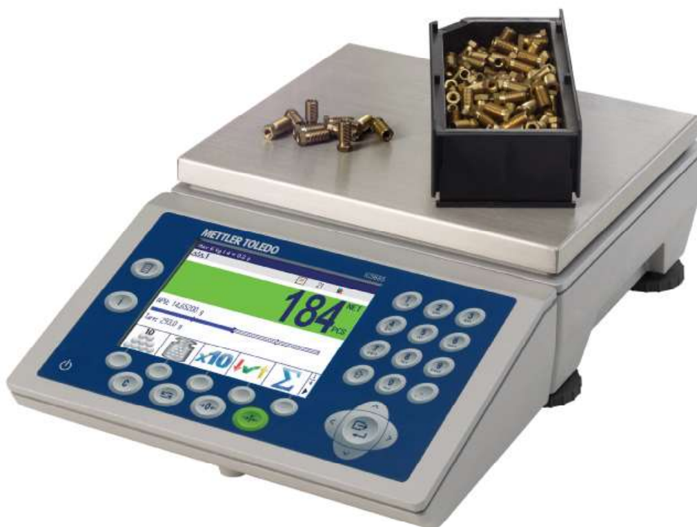
Рисунок 5 - Общий вид весов модификации ICS685s-6SM/f