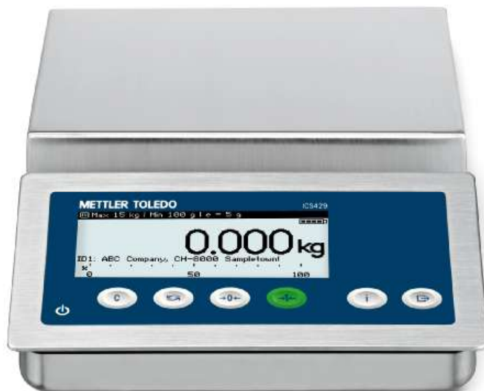
Рисунок 6 - Общий вид весов модификации ICS429g - A15/f