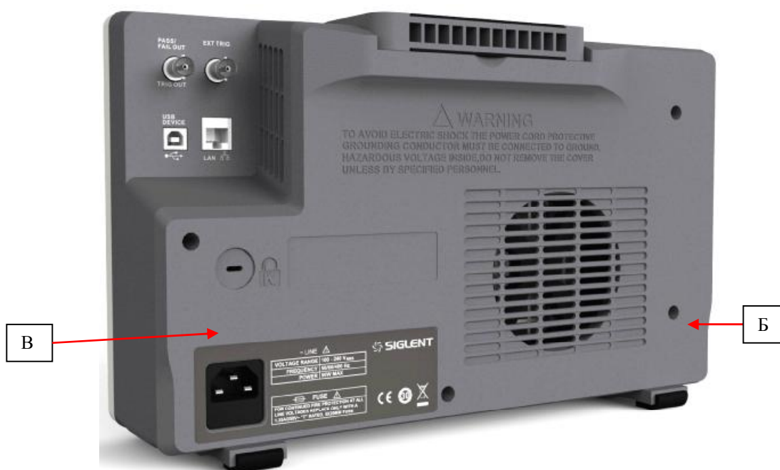
Рисунок 2 - Схемы пломбировки от несанкционированного доступа (Б) и нанесения знака поверки (В)