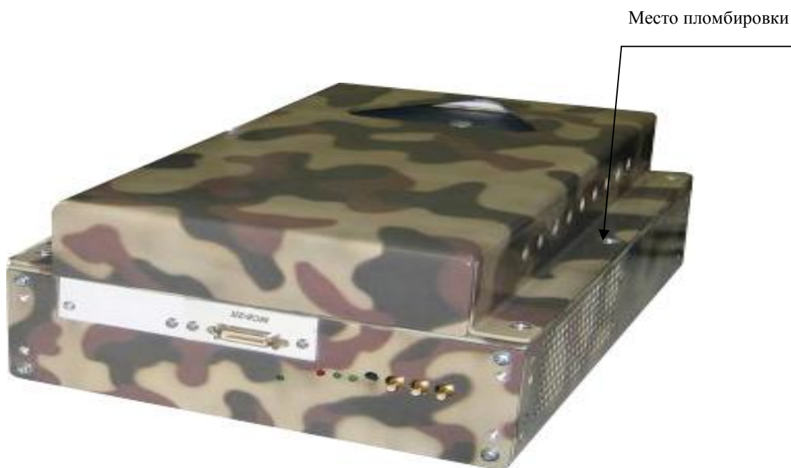
Рисунок 3 – Внешний вид устройства MezaBox\Battery 133W-hrs с установленным измерителем