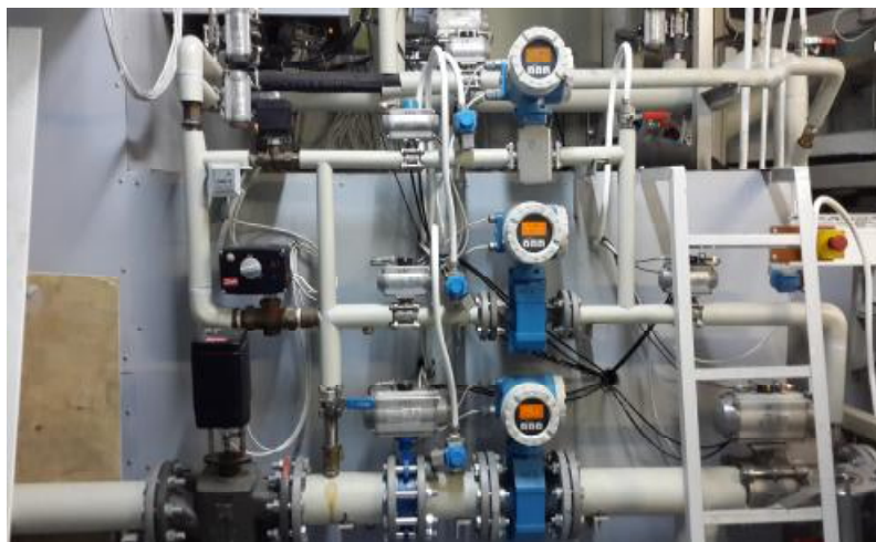
Рисунок 2 – Общий вид установки поверочной STEP-VMT-250/630-70

Пломбирование установки поверочной STEP-VMT-250/630-70 осуществляется нанесением знака поверки с помощью свинцовой (пластмассовой) пломбы и проволоки, которой пломбируются эталонные расходомеры. Места пломбирования в местах фланцевых соединений эталонных расходомеров приведены на рисунке 3.