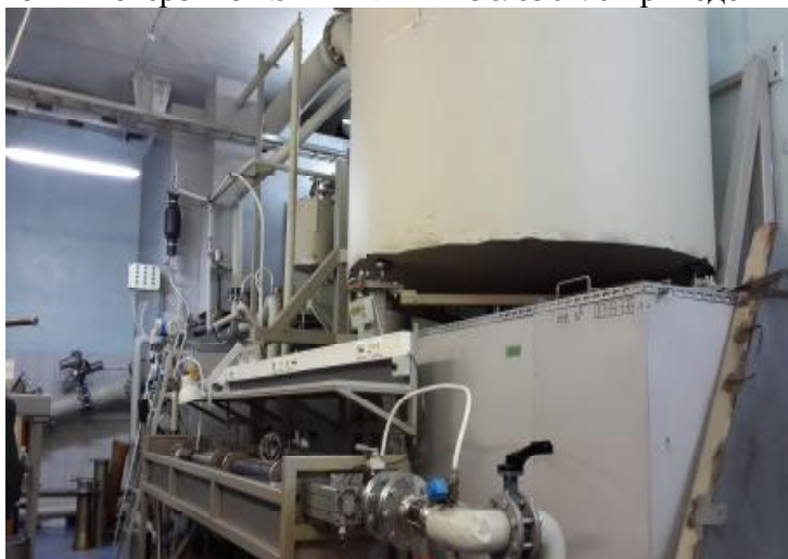
Рисунок 1 – Общий вид установки поверочной STEP-VMT-250/630-70

Общий вид установки поверочной STEP-VMT-250/630-70 приведен на рисунках 1 и 2.