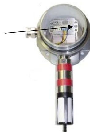
б) со снятой крышкой