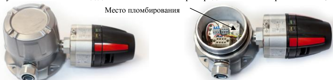
а) с крышкой