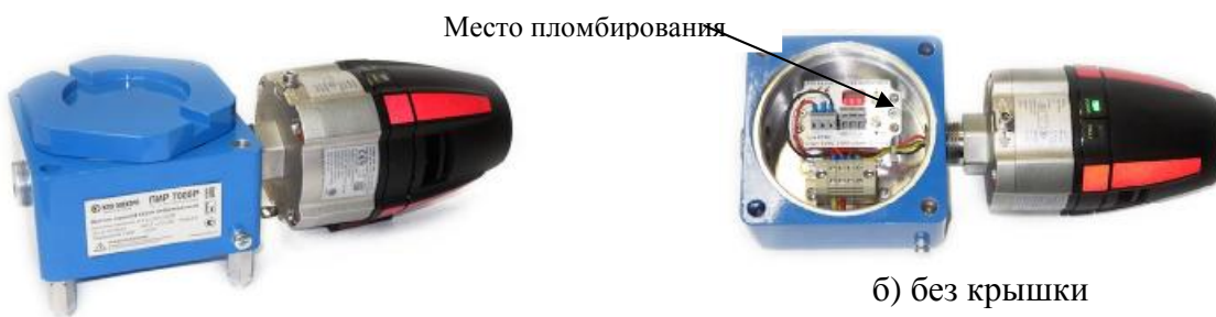
а) с крышкой