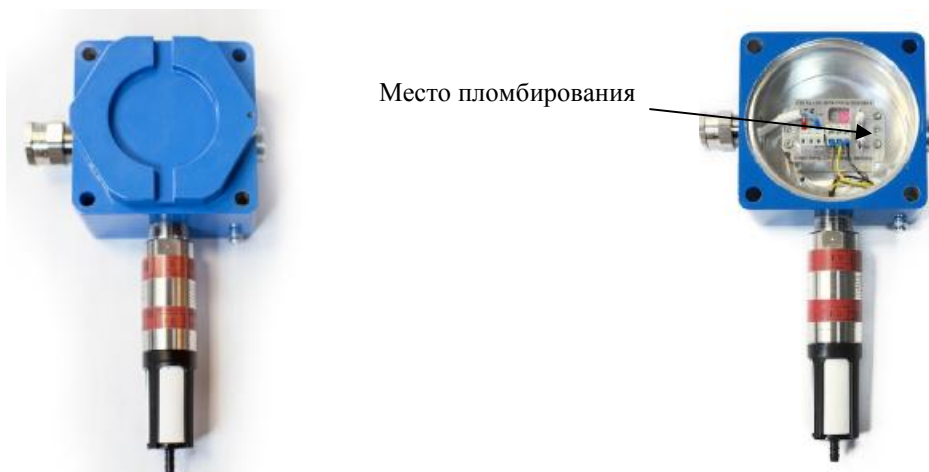
а) с крышкой