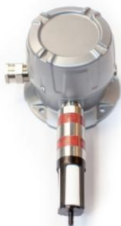
а) с крышкой

Внешний вид датчиков приведен на рисунках 1- 4.