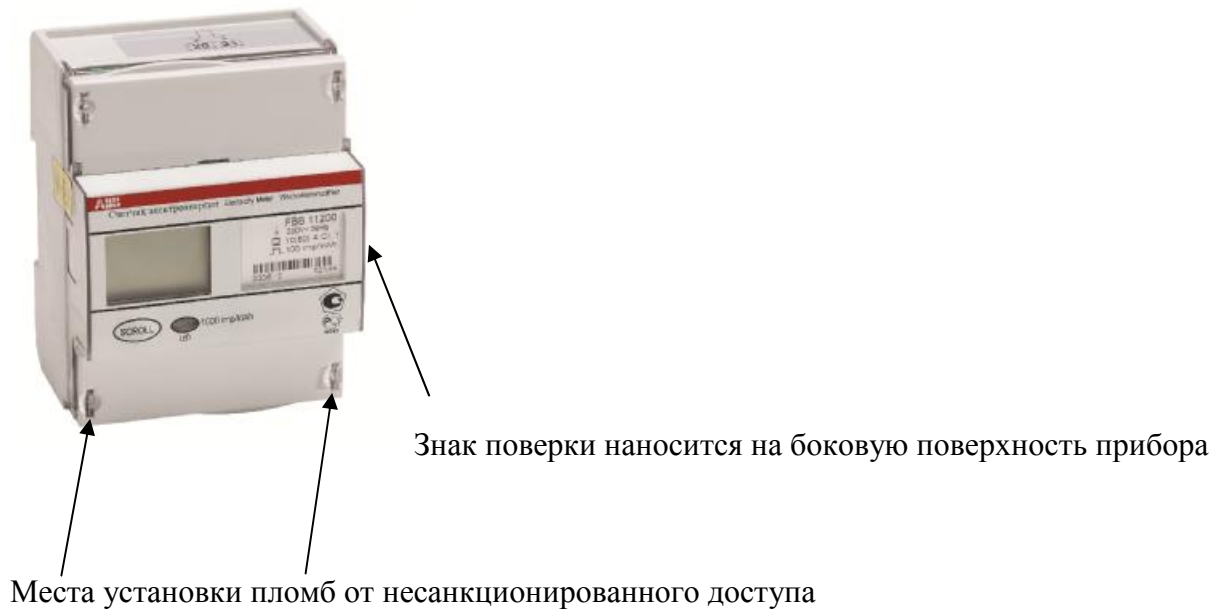
Рисунок 1. Фото внешнего вида счетчика