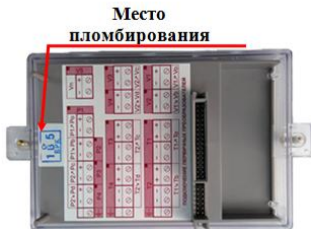
Рисунок 8 – Пломбирование тепловычислителя ЭЛЬФ