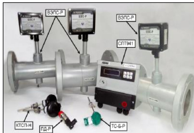
Рисунок 2 – Общий вид теплосчетчиков исполнения 02