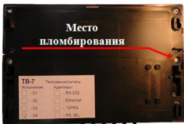
Рисунок 5 – Пломбирование тепловычислителя ТВ7