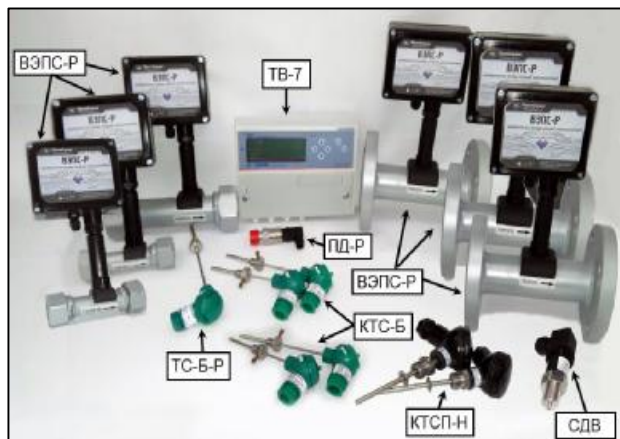
Рисунок 1 – Общий вид теплосчетчиков исполнения 01