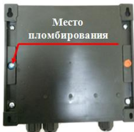
Рисунок 6 – Пломбирование тепловычислителя СПТ941