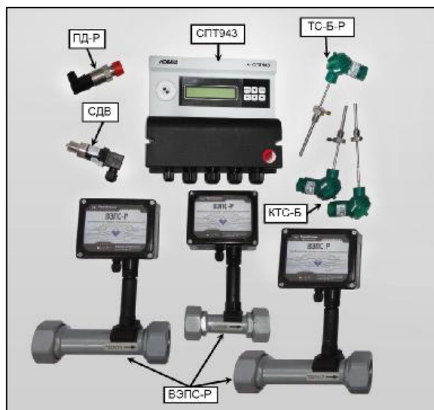
Рисунок 3 – Общий вид теплосчетчиков исполнения 03