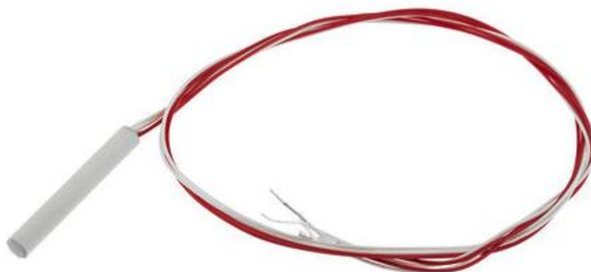
Рисунок 1 - Общий вид термопреобразователя сопротивления платинового 902821/81-386-2001-1-5-30-000-00-11-1300/362