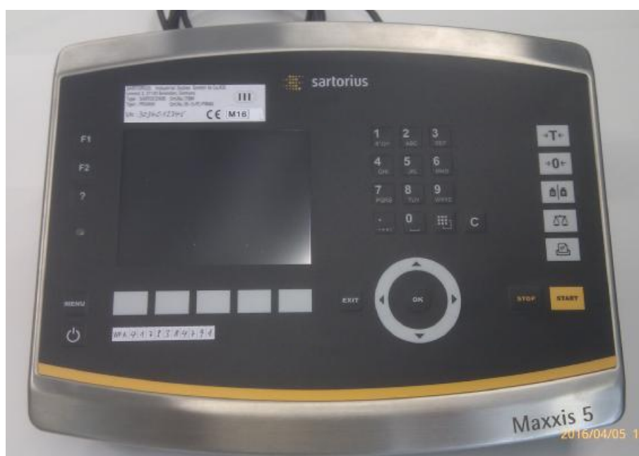
Внешний вид лицевой панели