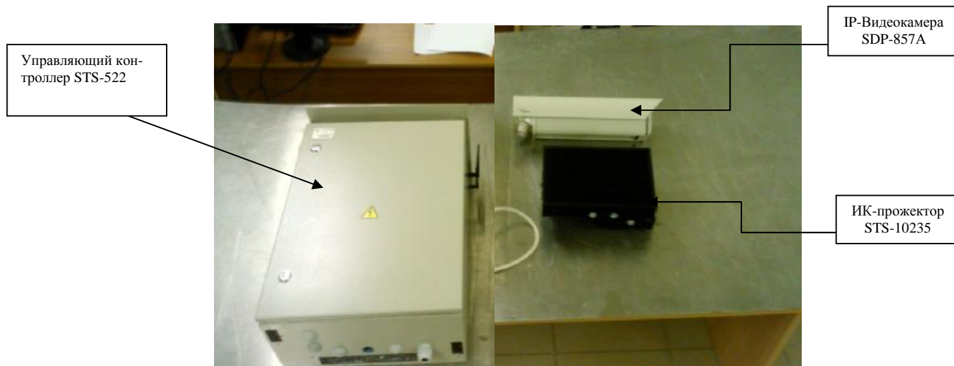
Рисунок 1 - Внешний вид системы

Датчик от несанкционированного доступа, находится под крышкой системы и срабатывает при вскрытии управляющего контроллера, данные передаются на центральный пост.