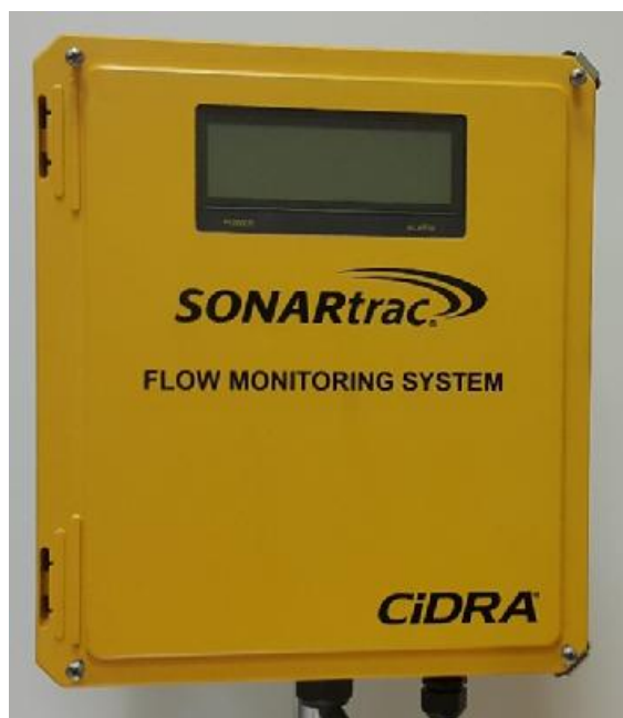
Рисунок 4 - Блок электроники

Блок электроники (рис.4) представляет собой выносной блок, соединённый кабелем с сенсорным блоком, и состоит из контроллера и встроенного жидкокристаллического экрана (рис.5).