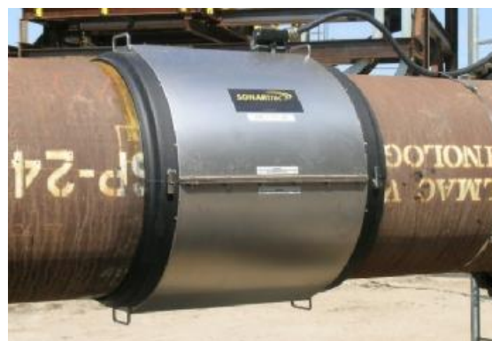
Рисунок 3 - Кожух из нержавеющей стали

Блок электроники (рис.4) представляет собой выносной блок, соединённый кабелем с сенсорным блоком, и состоит из контроллера и встроенного жидкокристаллического экрана (рис.5).