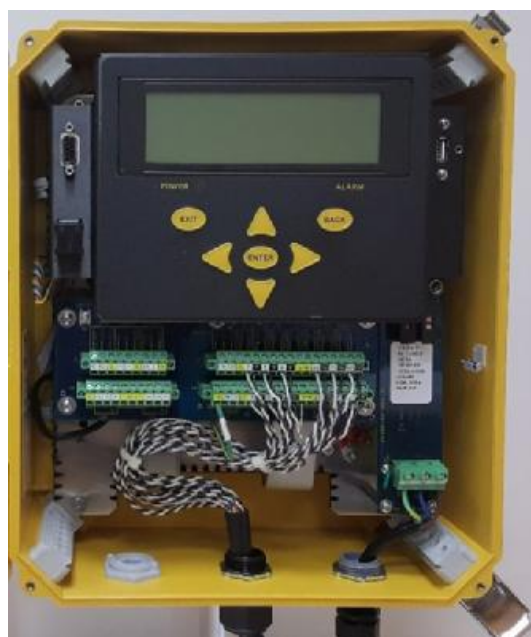
Рисунок 5 - Жидкокристаллический экран