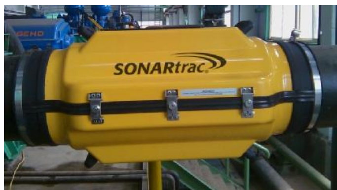
Рисунок 2 - Кожух из стекловолокна

Сенсорный блок состоит из комплекта накладных акустических датчиков, установленных в защитный кожух из стекловолокна (рис.2), или нержавеющей стали (рис.3), которые с помощью стяжных хомутов крепятся накладным образом вокруг технологического трубопровода.