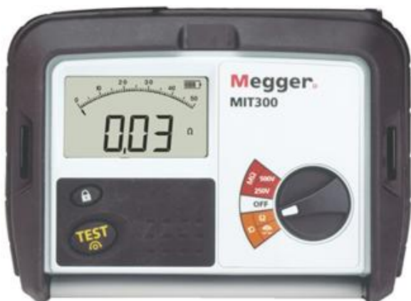
Рис. 5 - Внешний вид измерителей MIT300