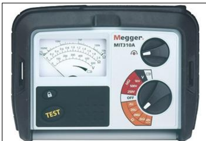
Рис. 7 - Внешний вид измерителей MIT310A