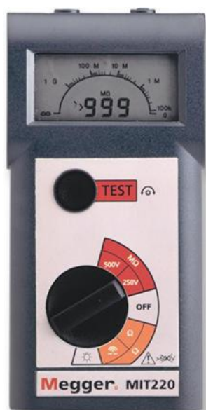
Рис. 3 - Внешний вид измерителей MIT220