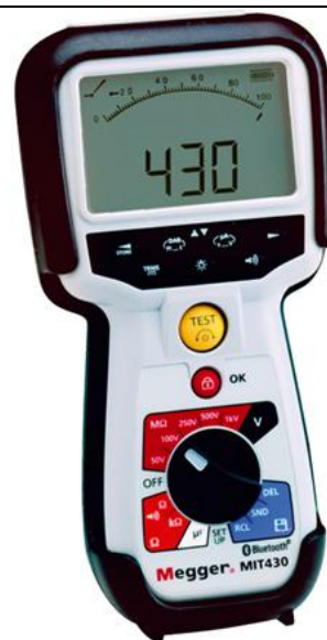
Рис. 14 - Внешний вид измерителей MIT430