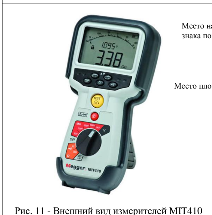
Рис. 11 - Внешний вид измерителей MIT410