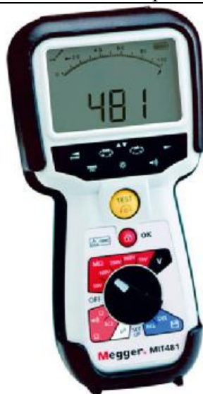
Рис. 21 - Внешний вид измерителей MIT481