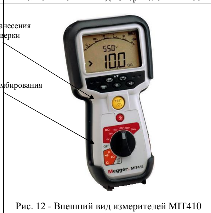
Рис. 12 - Внешний вид измерителей MIT415