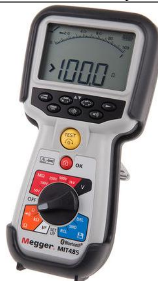
Рис. 22 - Внешний вид измерителей MIT485