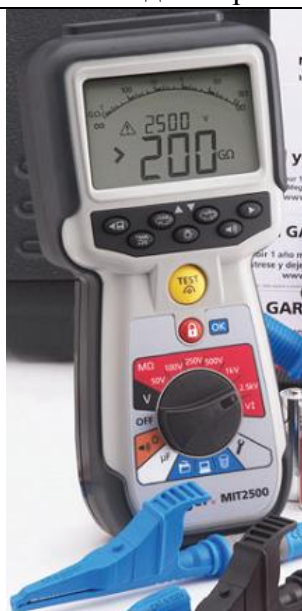
Рис. 23 - Внешний вид измерителей MIT2500