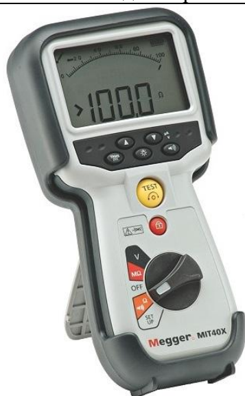
Рис. 15 - Внешний вид измерителей MIT40X