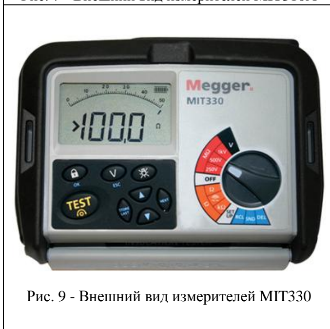
Рис. 9 - Внешний вид измерителей MIT330