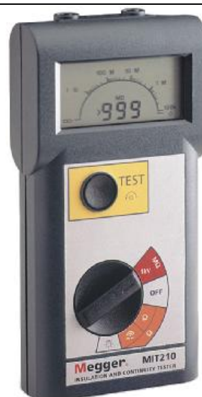
Рис. 2 - Внешний вид измерителей MIT210