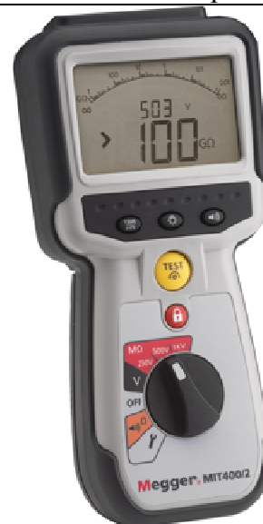
Рис. 16 - Внешний вид измерителей MIT400/2