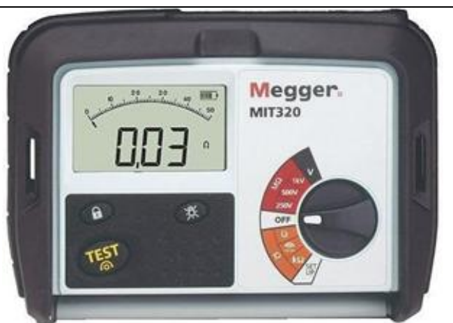
Рис. 8 - Внешний вид измерителей MIT320