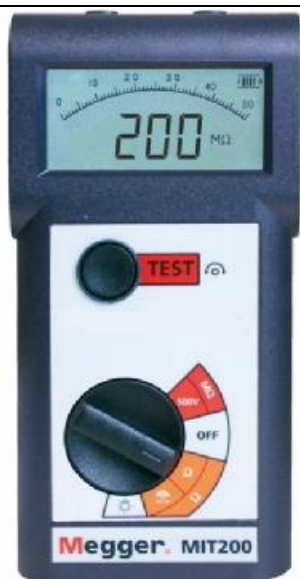
Рис. 1 - Внешний вид измерителей MIT200