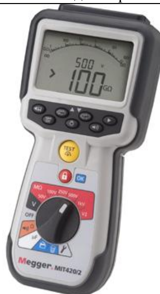
Рис. 18 - Внешний вид измерителей MIT420/2