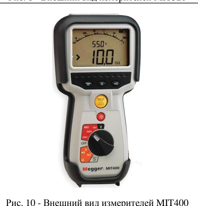
Рис. 10 - Внешний вид измерителей MIT400