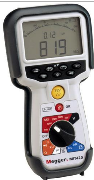
Рис. 13 - Внешний вид измерителей MIT420