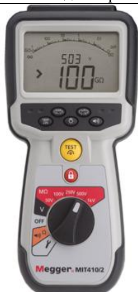
Рис. 17 - Внешний вид измерителей MIT410/2