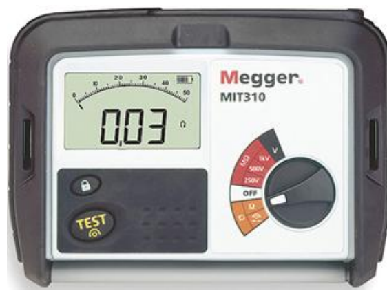
Рис. 6 - Внешний вид измерителей MIT310