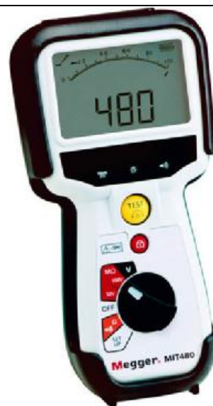
Рис. 20 - Внешний вид измерителей MIT480