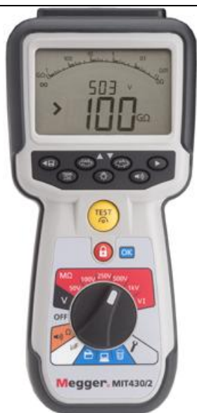
Рис. 19 - Внешний вид измерителей MIT430/2