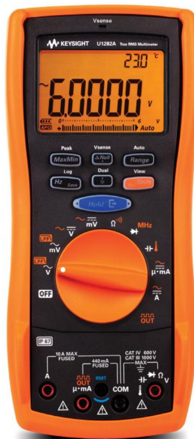
Рисунок 2 - Мультиметр цифровой U1282A