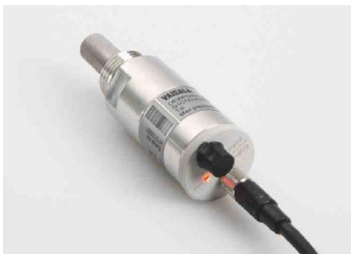
Рисунок 1 - Общий вид преобразователя точки росы измерительного DMT143

Схема пломбировки от несанкционированного доступа, обозначение места нанесения знака поверки представлены на рисунке 2.