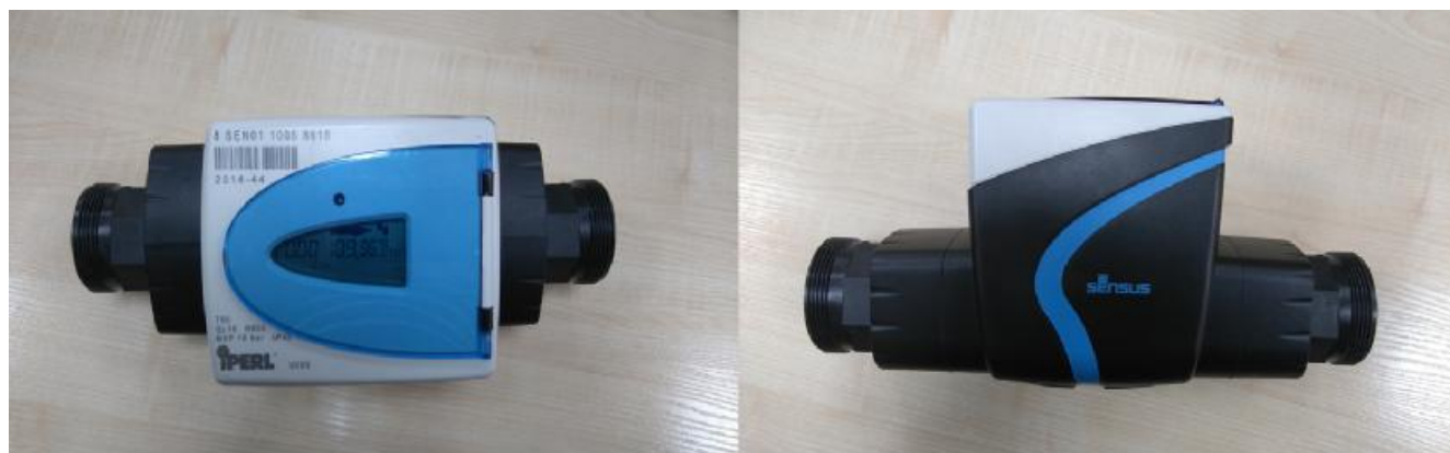
Рисунок 1 - Общий вид счетчиков холодной воды электромагнитных iPERL

Типоразмеры счетчиков отличаются нормированными значениями объема, габаритными и присоединительными размерами и массой.