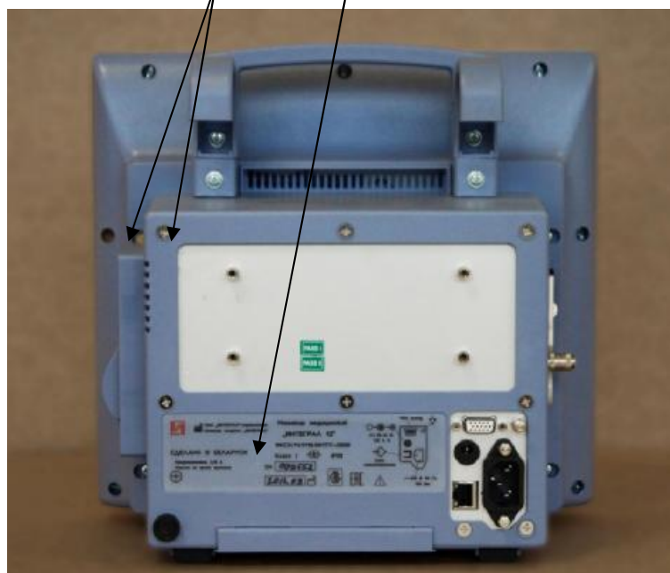
Рисунок 2 - Места нанесения знака утверждения типа и пломбирования