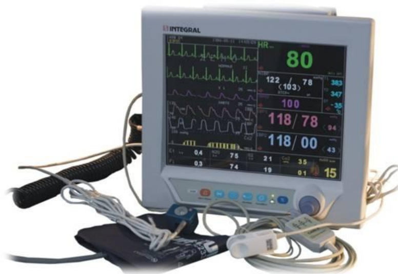
Рисунок 1 - Общий вид монитора медицинского «ИНТЕГРАЛ»

Место нанесения знака поверки показано на рисунке 3.