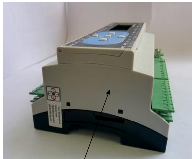
Место нанесения знака поверки