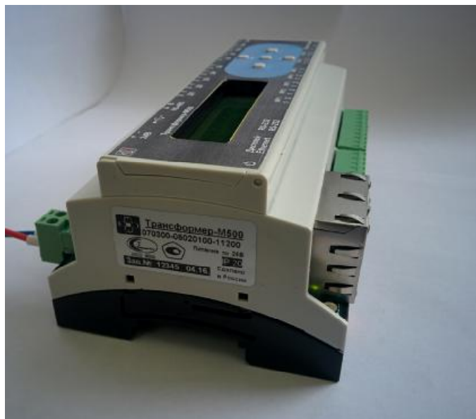
Рисунок 2 – Знак утверждения типа