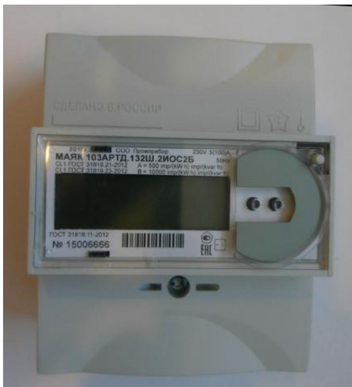
Рисунок 1 – Внешний вид счетчика с закрытой крышкой

Внешний вид счетчика МАЯК 103АРТД с закрытой клеммной крышкой приведен на рисунке 1.