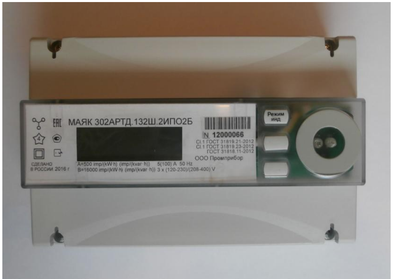
Рисунок 1 – Внешний вид счетчика с закрытыми крышками

Внешний вид счетчика МАЯК 302АРТД с закрытыми крышками приведен на рисунке 1.