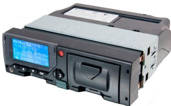
Рисунок 1 – Общий вид тахографа