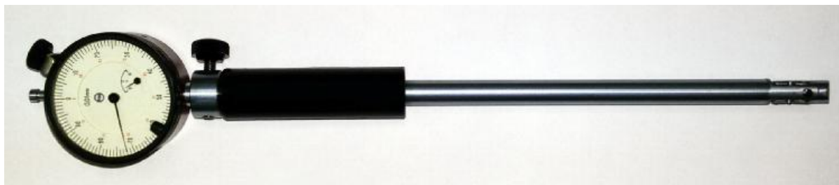
Рисунок 1 - Общий вид нутромеров индикаторных НИ 10-18