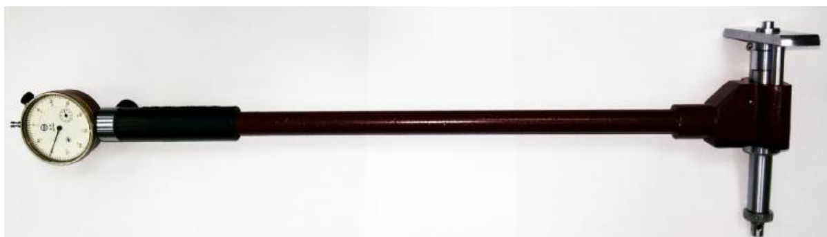
Рисунок 2 - Общий вид нутромеров индикаторных НИ 160-250