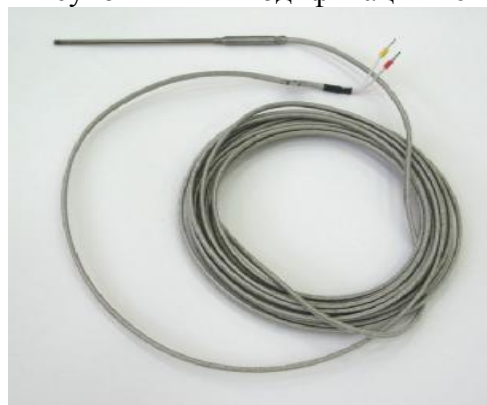
Рисунок 6 – ПТ модификации 301