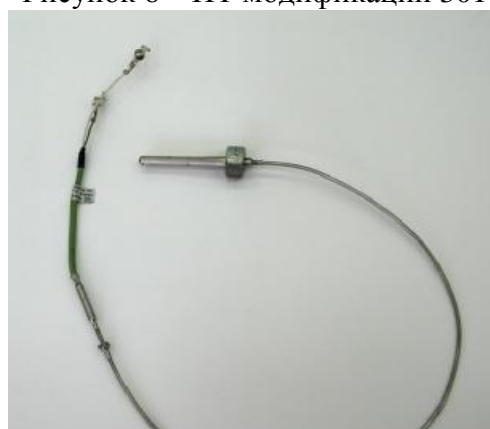
Рисунок 8 – ПТ модификации 3052