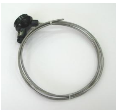
Рисунок 1 – ПТ модификации 101

Фотографии общего вида ПТ приведены на рисунках 1-9.