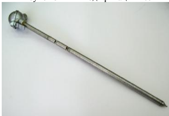
Рисунок 5 – ПТ модификации 205