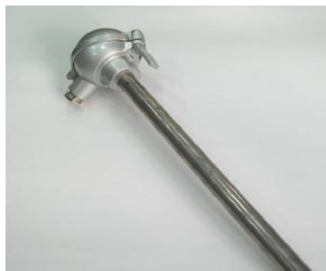
Рисунок 4 – ПТ модификации 204