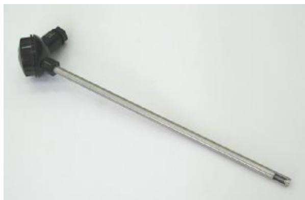
Рисунок 3 – ПТ модификации 105