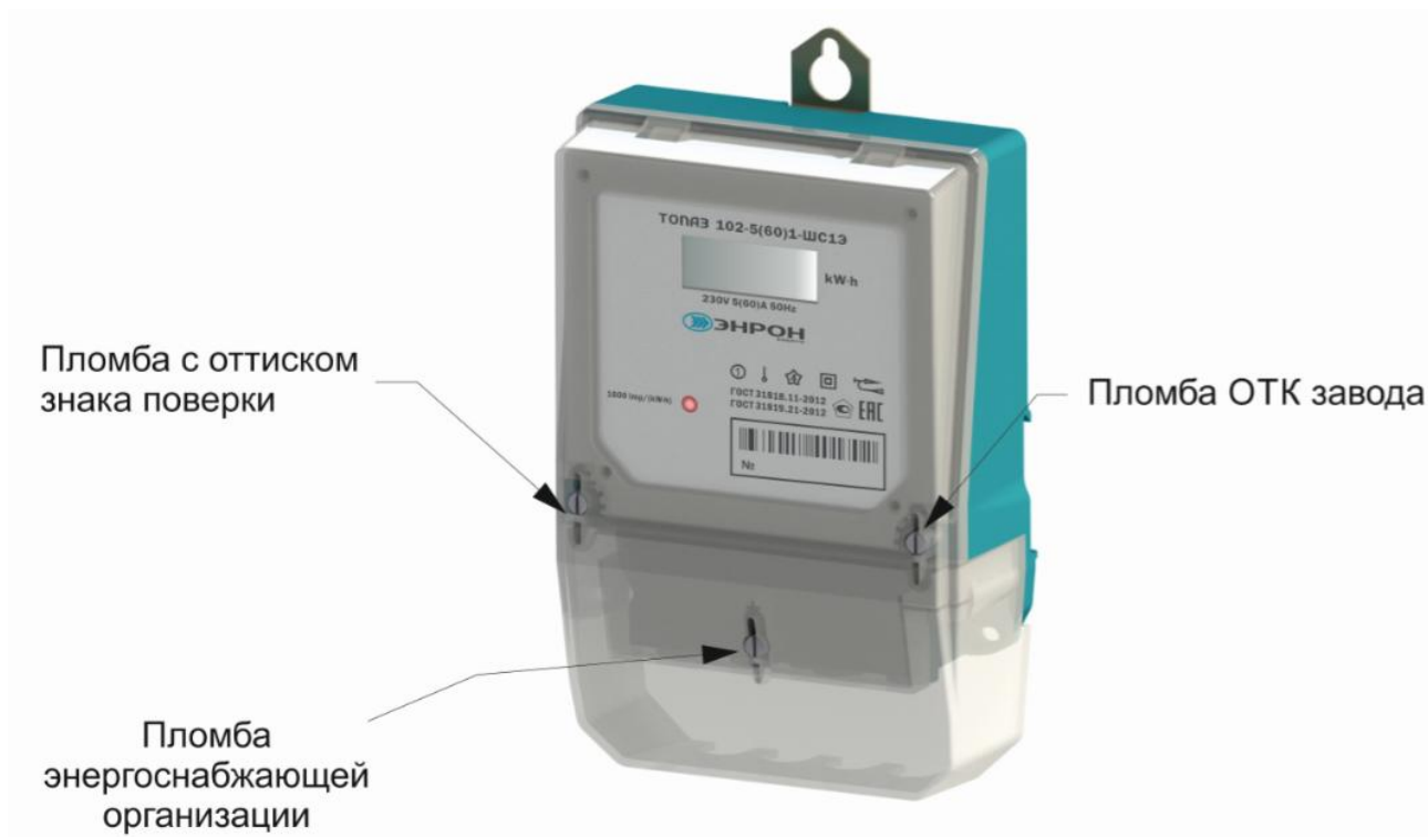
Рисунок 3 – Общий вид модификации счетчика ТОПАЗ 102