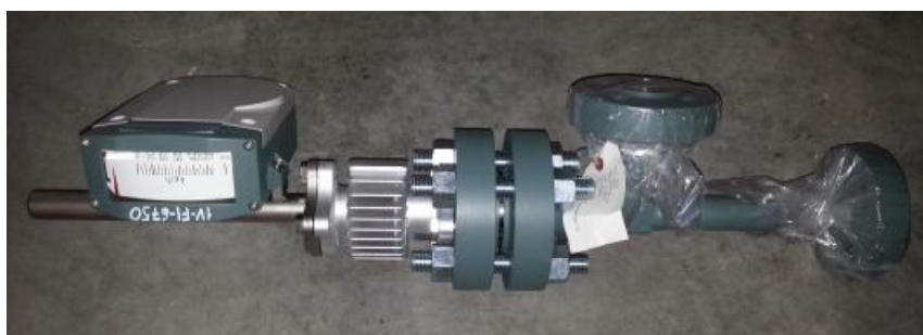
Рисунок 1 - Общий вид ротаметров AM72LW

Присоединение к трубопроводу фланцевое. Элементы ротаметров AM72LW, соприкасающиеся с измеряемой средой, изготовлены из нержавеющей стали.