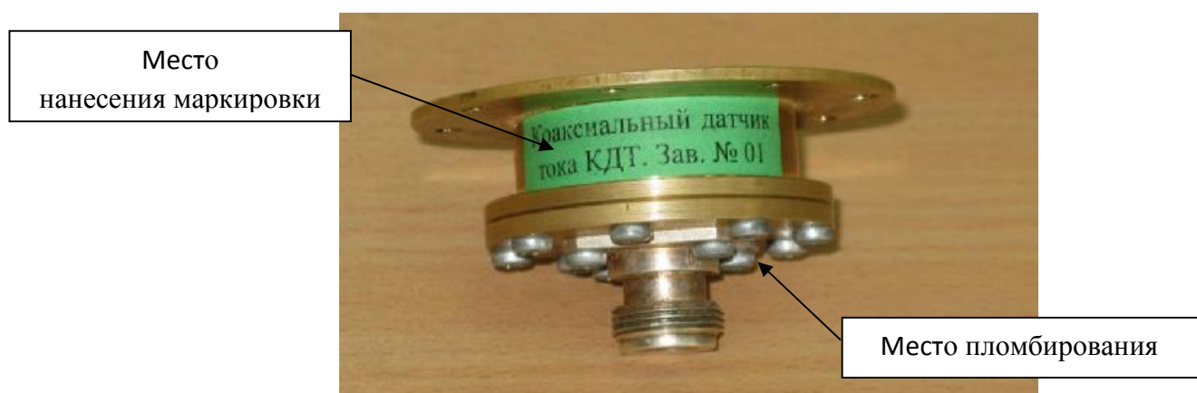
Рисунок 2 - Общий вид шунта коаксиального датчика тока КДТ с обозначением мест нанесения маркировки и пломбирования