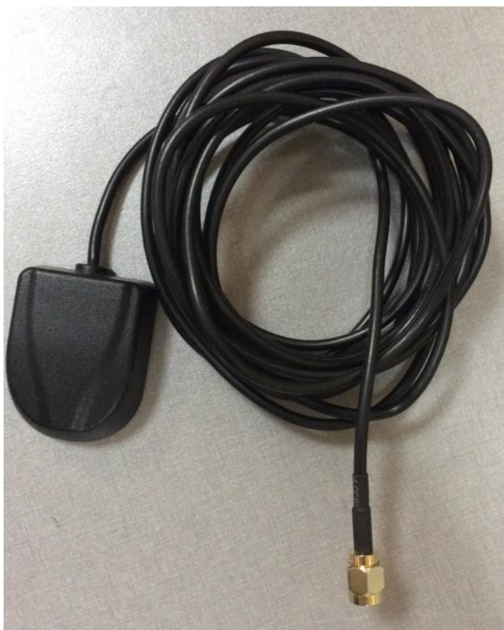
Рисунок 3 - Внешний вид штатной всенаправленной антенны ГНСС ГЛОНАСС и GPS