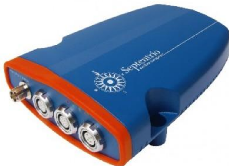
Рисунок 3 - Внешний вид приемника ГНСС ГЛОНАСС и GPS AsteRx2eL Septentrio