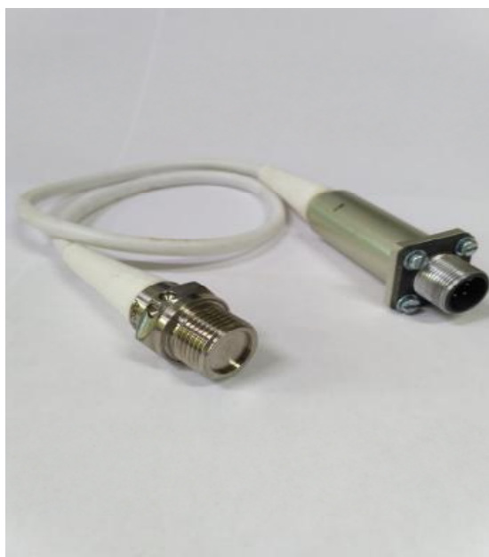
Рисунок 1-Фотография общего вида преобразователя давления ДХС 517

Фотография общего вида преобразователя давления ДХС 517 приведена на рисунке 1, габаритные и установочные размеры - на рисунке 2.