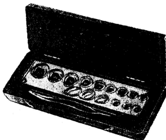
Гири образцовые, типа ГО1

Гири образцовые, типа ГО1, выпускаются в обращение комплектно, в килограммовых, граммовых и миллиграммовых наборах.