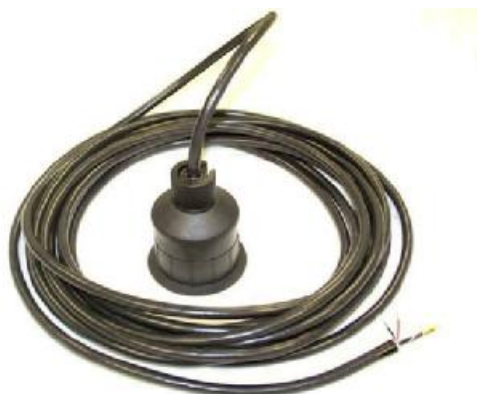
Рисунок 3 - Датчик уровня, модель TIENet 310