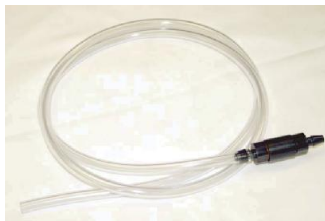
Рисунок 2 - Датчик уровня, модель TIENet 330