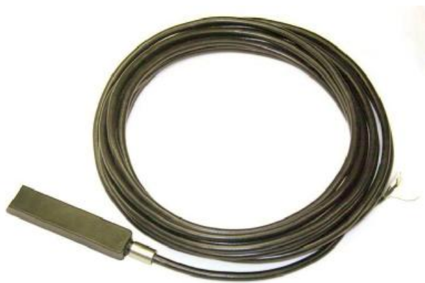
Рисунок 1 - Комбинированный датчик скорости и уровня, модель TIENet 350

Внешний вид датчиков (скорости и уровня) и электронного блока представлен на рисунках 1-5. Все модели датчиков скорости и уровня имеют неразъемный корпус, поэтому пломбирование не производится. Пломбирование электронного блока производится путем установки пломбы на замке крышки корпуса.