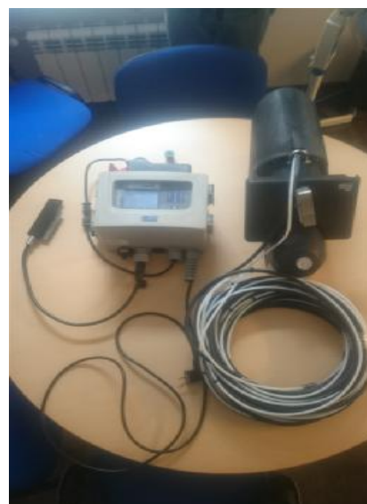
Рисунок 4 - Расходомер в сборе