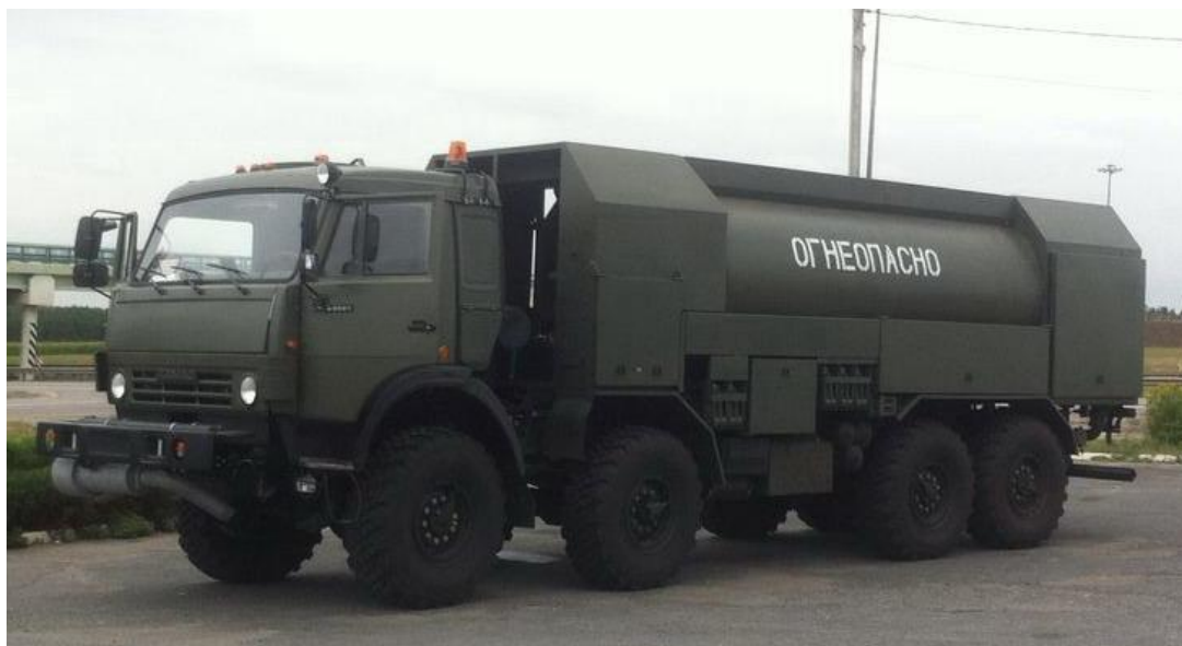
Рисунок 1 - Общий вид автотопливозаправщиков массовой выдачи АТЗ-12-10-63501

Места пломбирования элементов конструкции автотопливозаправщика для защиты от несанкционированного доступа к перевозимому (храняемому) нефтепродукту обозначены на рисунках №№ 2, 3