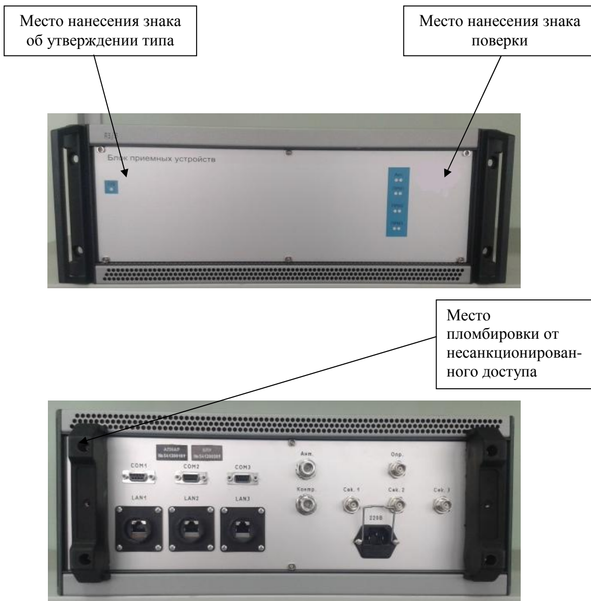
Рисунок 3 - Внешний вид блока приемных устройств и мест нанесения знака (наклейки) об утверждении типа, знака поверки и пломбировки от несанкционированного доступа