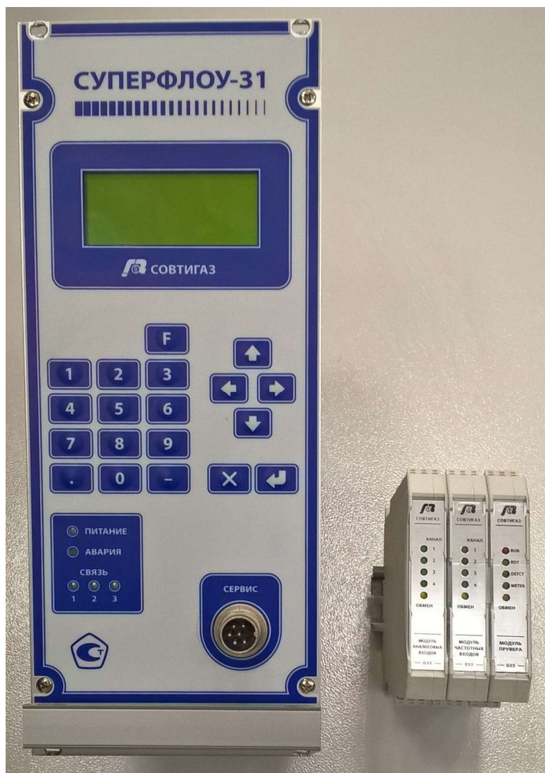
Рисунок 1 - Общий вид контроллеров

Общий вид контроллера (вычислитель и модули расширения) изображен на рис.1.