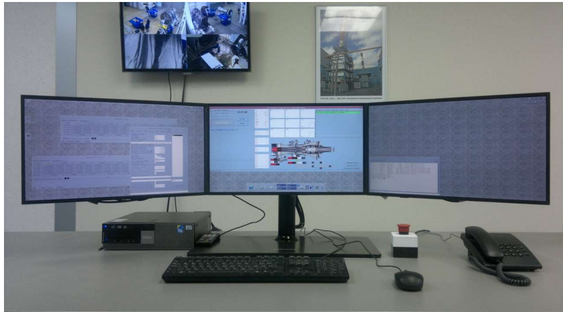
Рисунок 4 - Рабочее место ведущего испытания (станция Dell OptiPlex 980)