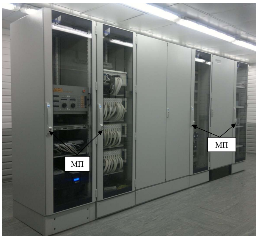
Рисунок 1 - Оборудование нижнего уровня ИИС «СИ-41/САТУРН»

Внешний вид составных частей ИИС «СИ-41/САТУРН» с указанием мест пломбировки (МП) от несанкционированного доступа к системе приведен на рисунках 1, 2, 3, 4.