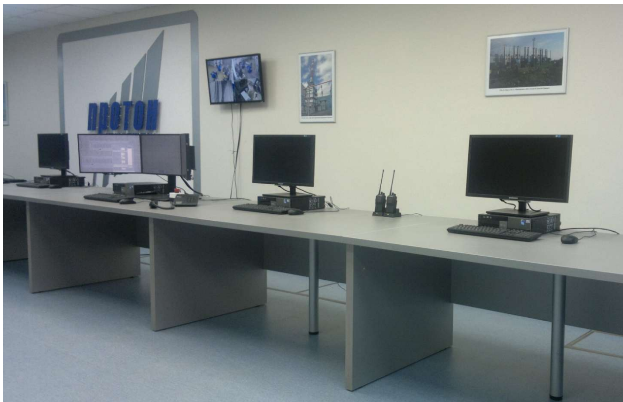
Рисунок 3 - Оборудование верхнего уровня ИИС «СИ-41/САТУРН»