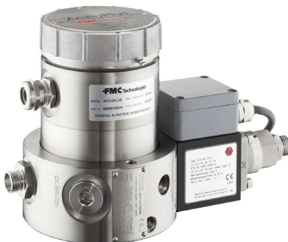
Рисунок 1 - Общий вид счетчиков жидкости камерных AccuPlus

Общий вид счетчиков жидкости камерных AccuPlus приведен на рисунке 1.