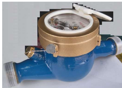
Рисунок 1 - Общий вид счетчиков холодной и горячей воды крыльчатых многоструйных ТК