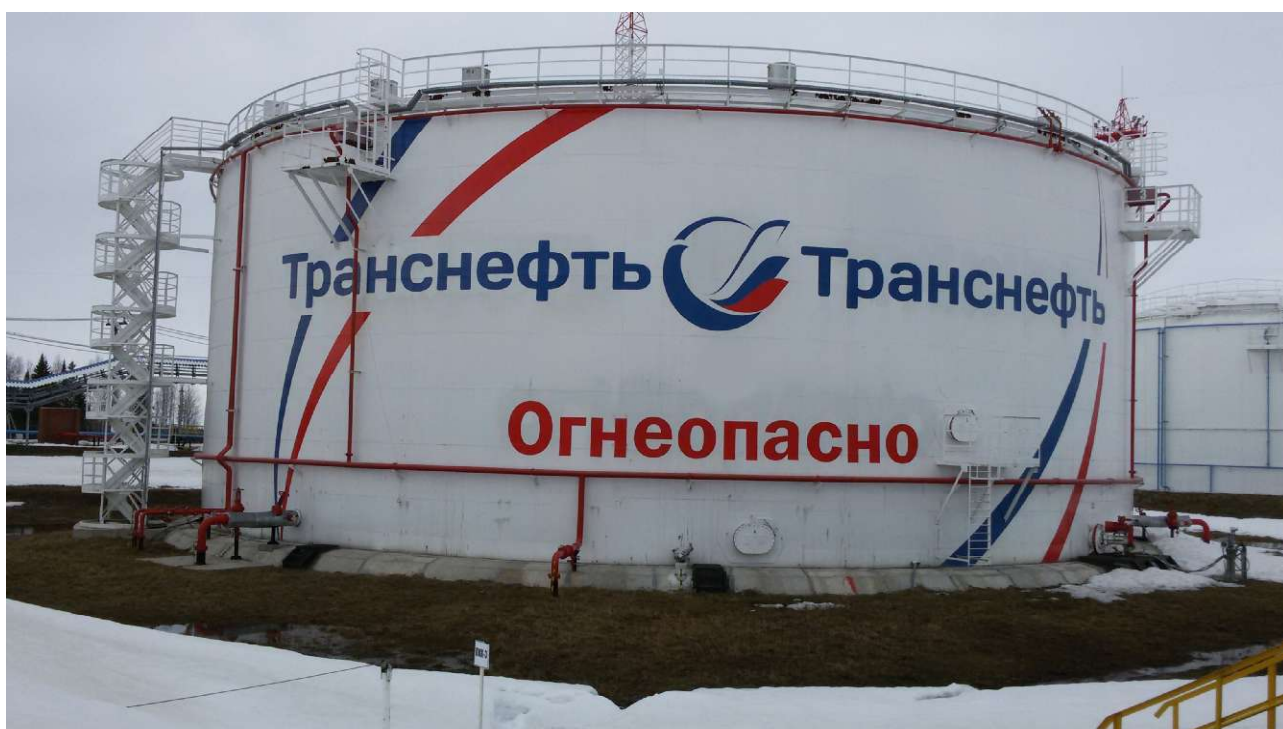
Рисунок 3 - Общий вид резервуара вертикального стального цилиндрического РВСП-10000