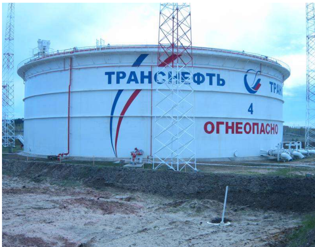
Рисунок 6 - Общий вид резервуара вертикального стального цилиндрического РВСПК-50000