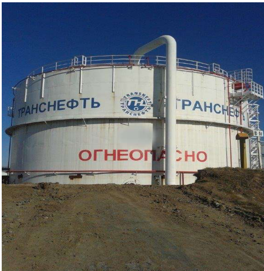
Рисунок 2 - Общий вид резервуара вертикального стального цилиндрического РВС-5000