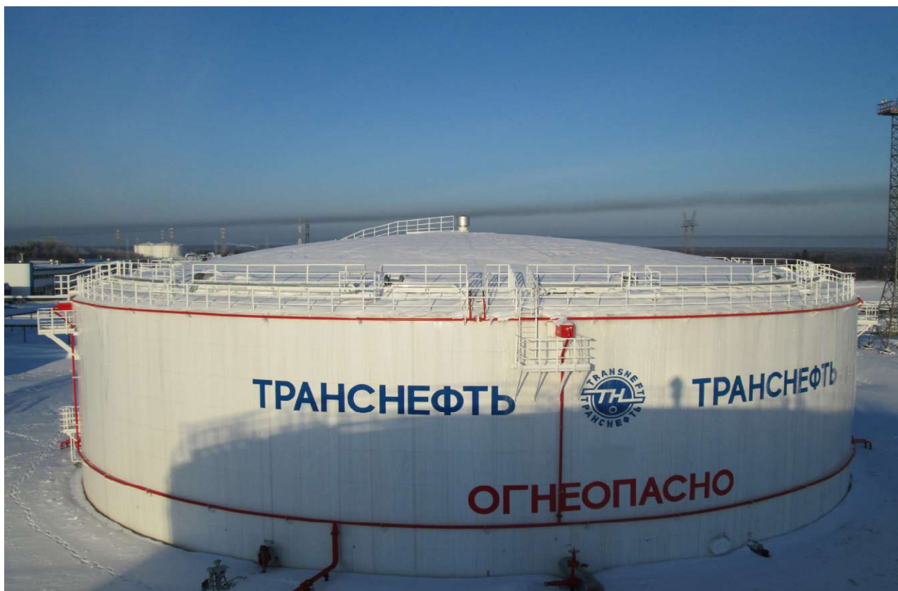
Рисунок 5 - Общий вид резервуара вертикального стального цилиндрического РВСП-20000