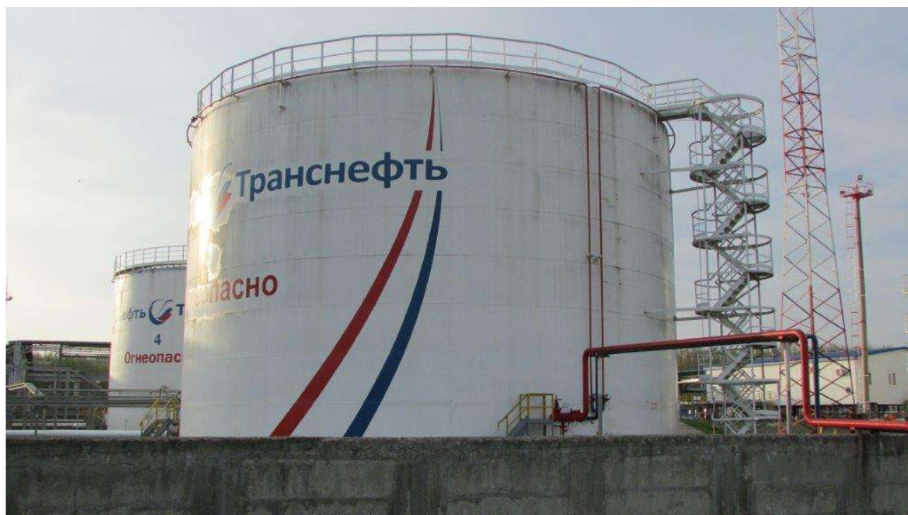
Рисунок 1 - Общий вид резервуара вертикального стального цилиндрического РВС-3000