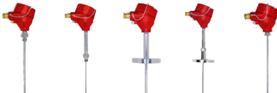
Рисунок 3 - Термопреобразователи в искро- и взрывобезопасном исполнении