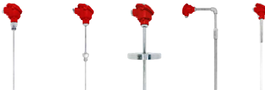
Рисунок 1 - Термопреобразователи в корпусном исполнении

Пломбирование термопреобразователей не предусмотрено.