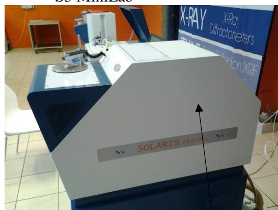
Рисунок 4 - Модификация S5 Solaris CCD Plus