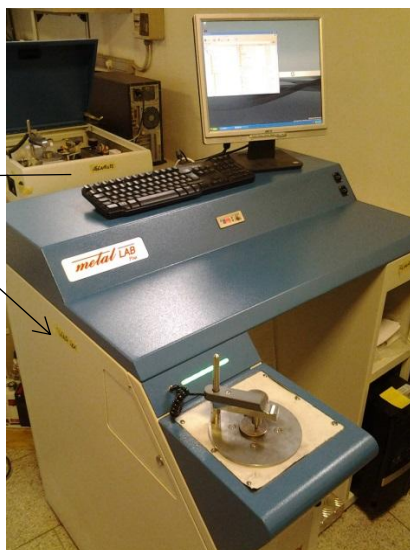
Рисунок 5 - Модификация S7 Metal Lab Plus