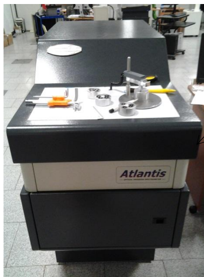
Рисунок 6 - Модификация S9 Atlantis