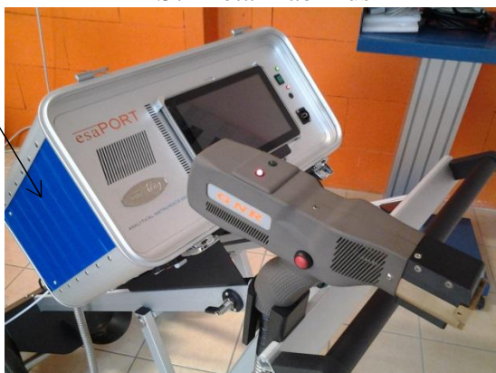
Рисунок 7 - Модификация E3 Esaport